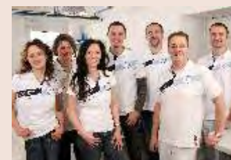
Team CAD-CAMTECH Thüringen GmbH & Co.KG