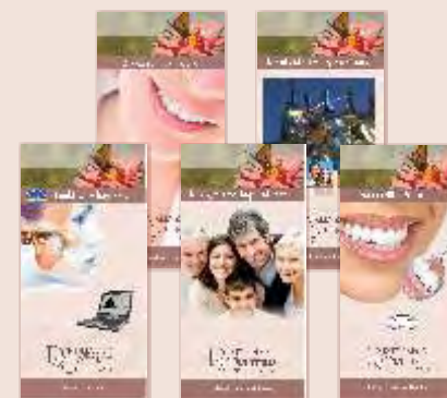
Maxi Findeiß · Zahntechnikermeisterin - Beratung POS-System