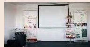
Unser laboreigener Seminar-Raum in Erfurt